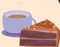
KAFFEE UND KUCHEN